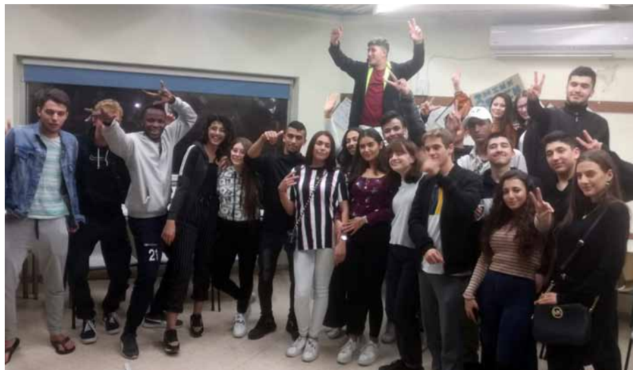
Austausch mit Jugendlichen der Givat Haviva International School (Das Foto entstand vor der Party)