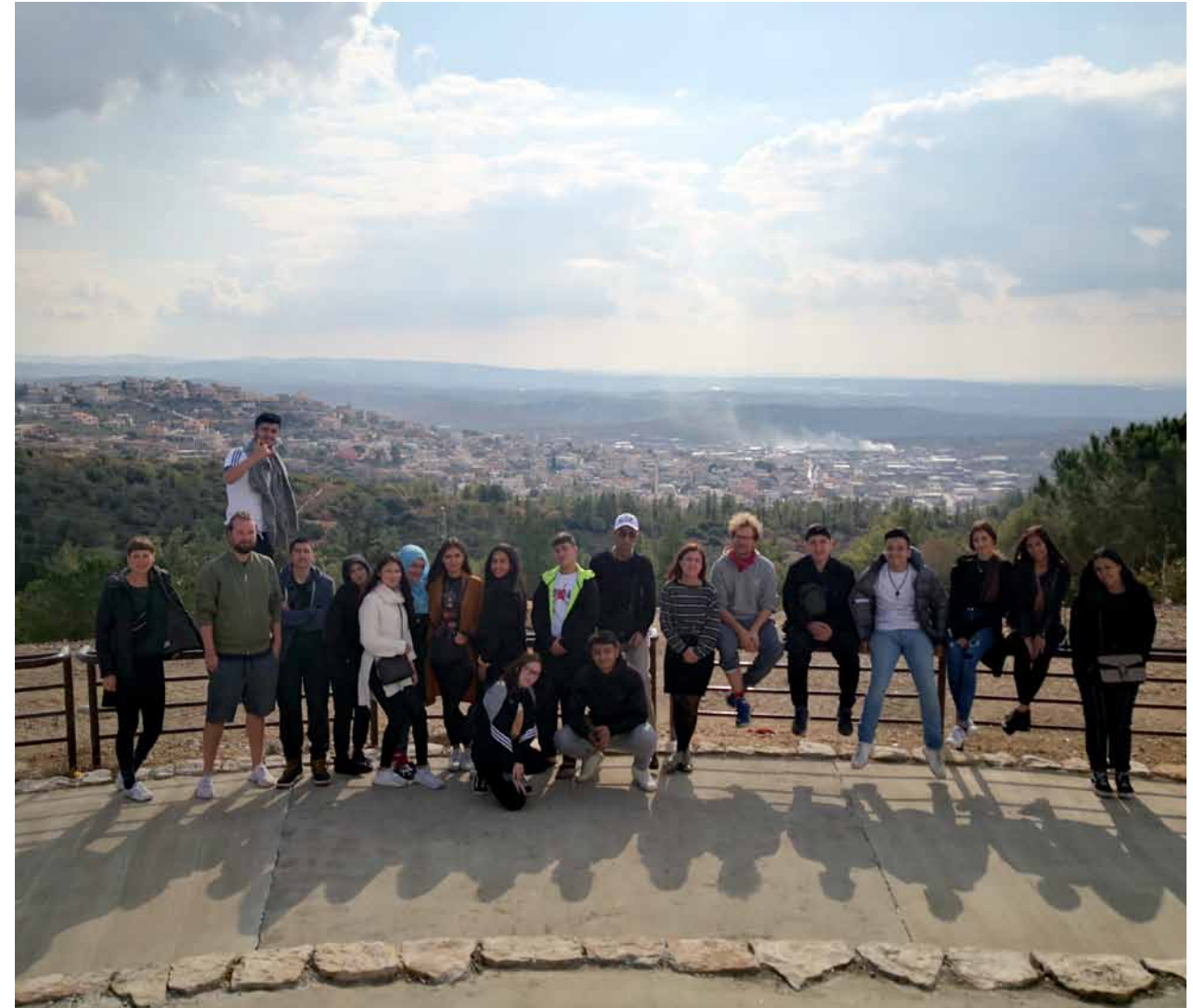
Tour entlang der Green Line