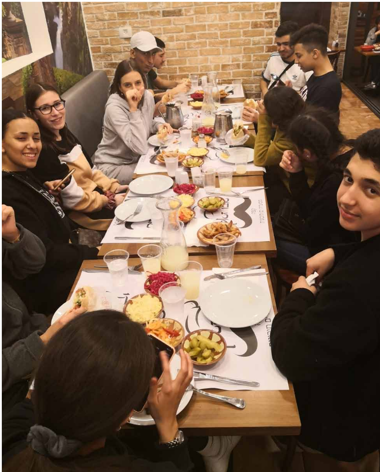
Arabisch Essen am ersten Tag in Tel Aviv