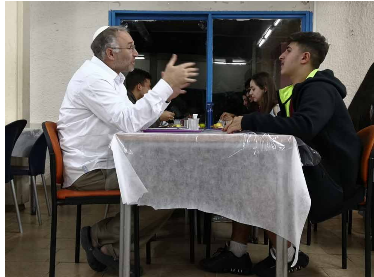
Spontanes Kantinengespräch in Givat Haviva