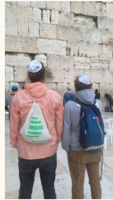
An der Klagemauer