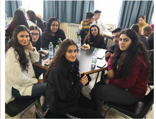
Begegnung mit palästinensischen Jugendlichen in Talitha Kumi