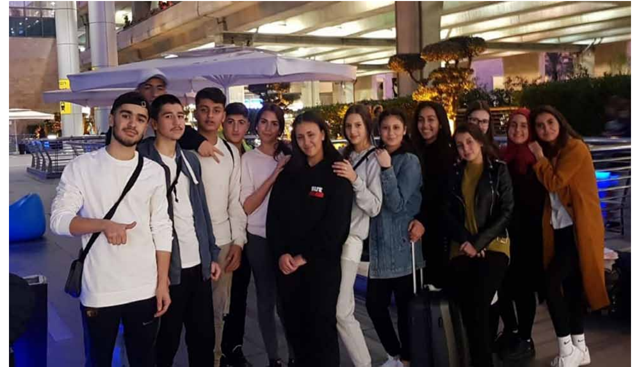
Ankunft am Flughafen Ben Gurion