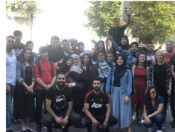
Begegnungen mit israelischen Jugendlichen in Berlin und Fragen an die Jugendlichen

Wichtig war auch wiederum, dass ein möglichst barrierefreier Zugang geschaffen werden sollte, indem historische Orte besucht wurden, die den Jugendlichen so nähergebracht wurden, dass sie sich diese gut erschließen konnten. ◀