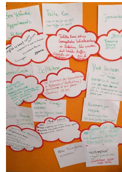
Reiseplanungen während des Projekttages