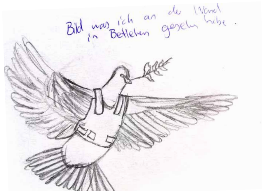
Ausschnitte aus den Reisetagebüchern