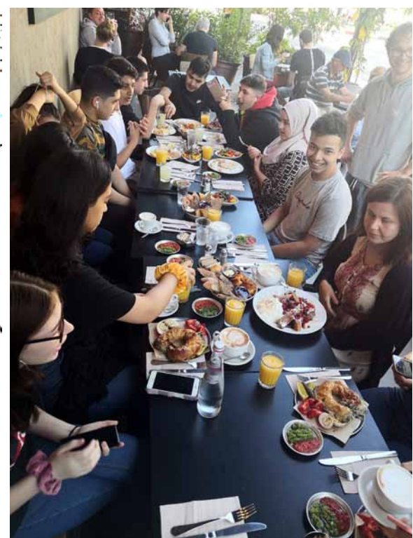
Israelisches Frühstück am ersten Morgen

Tag 2 01.12.19 Tel Aviv → Norden teil ASAP ES war ein Atemberaubender Tag. Wunder schön und beruhigend die Stadt? Man fühlte sich wdh in seiner Haut, allein das ein und aus atmen fühlte sich so gut an.