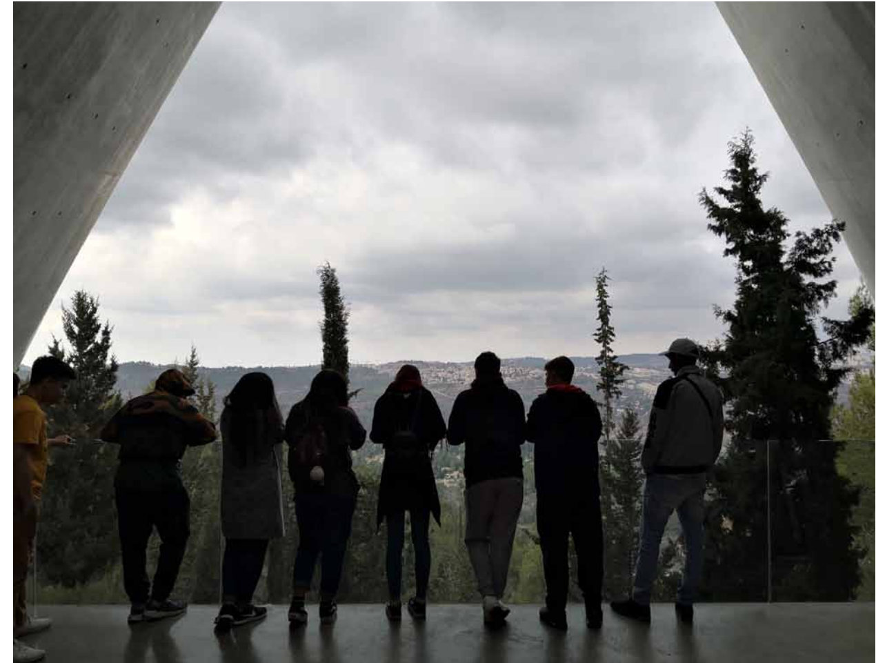
Internationale Holocaustgedenkstätte Yad Vashem

Als Vorbereitung auf die Reise erfolgte eine Recherche der Jugendlichen zu verschiedenen Orten unserer bevorstehenden Reise. Außerdem wurden die Interessen der Teilnehmenden nochmals gebündelt gesammelt, indem mögliche Aufgaben für die Umsetzung auch an die Teilnehmenden übergeben wurden, wie etwa die Idee der Jugendlichen, die Reise auch filmisch zu dokumentieren. Durch die Einführung in die geplanten Programmpunkte war es für die Teilnehmenden möglich, Kontakt zu Menschen vor Ort aufzunehmen, um eventuell Familienangehörige oder Verwandte zu treffen. Um die Interessen der Teilnehmenden mitberücksichtigen zu können und auch die Programmplanung partizipativ zu gestalten, ist eine frühzeitige Einbindung der Gruppe notwendig. ◀