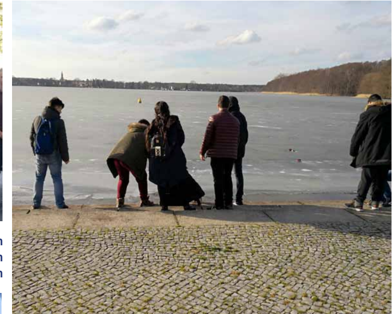
Exkursion in die Mahn- und Gedenkstätte Ravensbrück