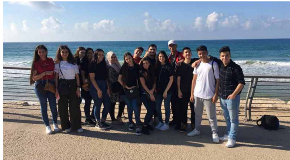
In Tel Aviv