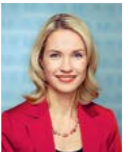
Manuela Schwesig Bundesministerin für Familie, Senioren, Frauen und Jugend