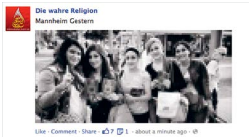
DIE "LIESI"-KAMPAGNE: SALAFISTISCHE PROPAGANDA IN FUSSGÄNGERZONEN UND SOZIALEN NETZWERKEN

Anmerkung: All diese Merkmale können Hinweise auf Ideologisierungen oder Radikalisierungen sein, sie müssen es aber nicht. Grund zur Beunruhigung besteht in der Regel erst, wenn mehrere Merkmale zusammen kommen.