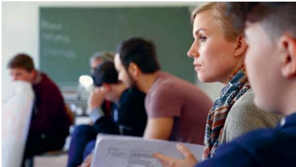
UFUQ-WORKSHOP MIT JUGENDLICHEN IN EINER BERLINER SCHULE

ufuq.de arbeitet seit 2007 wissenschaftlich, publizistisch und pädagogisch zu Jugendkulturen, Islam, Islamfeindlichkeit, Islamismus und politischer Bildung. Die Mitarbeiter_innen des Berliner Vereins sind Islam-, Kultur- und Sozialwissenschaftler_innen, Pädagog_innen und Didaktiker_innen. Ziel unserer Arbeit ist es, dazu beizutragen, dass Islam und Muslim_innen in Deutschland zu einer Selbstverständlichkeit werden – wobei schwierige Fragen und Konflikte nicht ausgeklammert werden, sondern nach einem konstruktiven Umgang gesucht wird. Der Verein betreibt dazu ein Internetportal , liefert Hintergrundinformationen, erstellt Materialien und Methoden für die pädagogische Praxis, bietet in einigen Städten Teamer-Workshops mit Jugendlichen und bundesweit Fortbildungen für Multiplikator_innen an. Außerdem beraten wir Politik, Medien, Kommunen, Schulen und Jugendeinrichtungen.