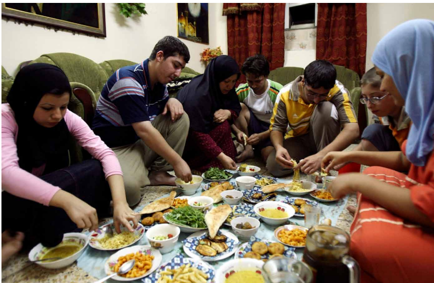
Gerade für Kinder und Jugendliche ist der Ramadan eine besondere Festzeit. (Im Bild eine schiitische Familie in Bagdad.)

Einfache Lösungen im Konflikt zwischen religiöser Freiheit und der Beeinträchtigung von Unterrichtsleistungen durch das Fasten gibt es nicht. Als „best practice“ hat sich eine Haltung von Schule und Lehrern erwiesen, die von Rücksichtnahme, Respekt und Offenheit gegenüber religiös begründeten Verhaltensweisen geprägt ist