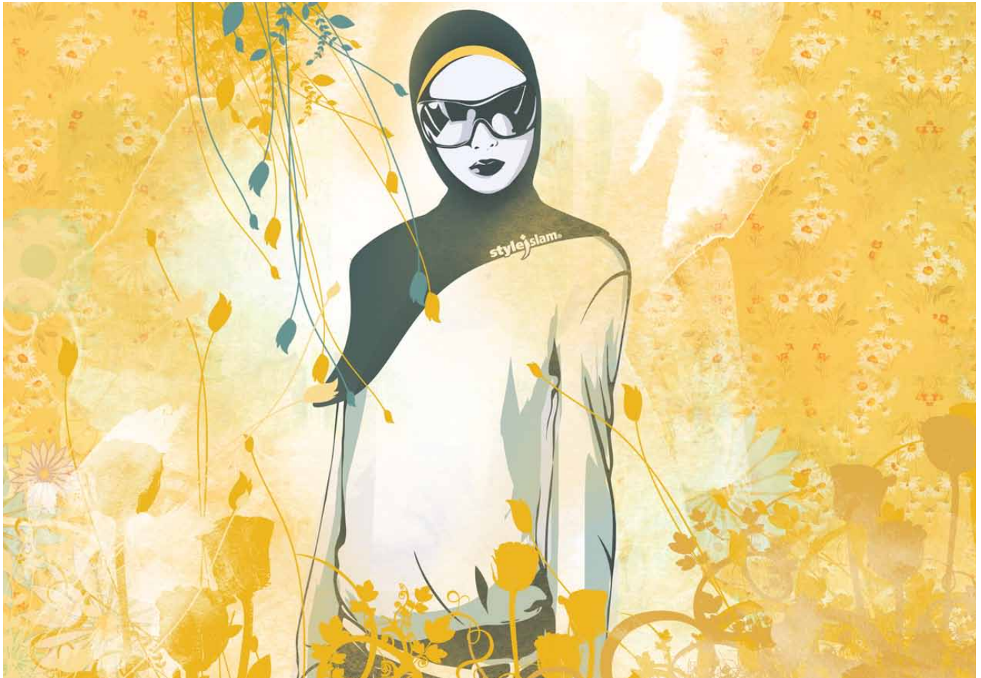
„Misty roses“. Hintergrundbild für den Computer, angeboten vom Lifestylelabel Style-Islam

unter anderem, weil das junge Unternehmen alle paar Wochen mit neuen islamischen Gimmicks und Gadgets für seine jungen Kunden aufwartet. Aktuell wirbt Style-Islam zum Beispiel mit einer Umhängetasche mit dem Logo des Labels – der messenger bag .