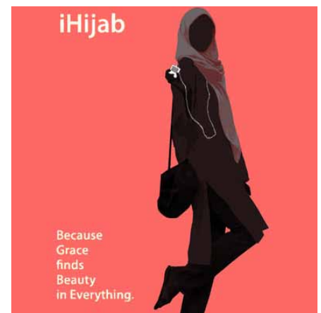
Ipod und Islam. Selbstbewusster islamischer Lifestyle

Auf Style-Islam haben wir schon in früheren Ausgaben des Newsletters hingewiesen –