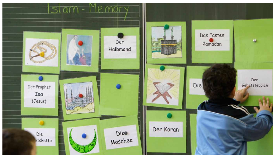
Islam-Memory in der Schule. Islamischer Religionsunterricht in Stuttgart

...tung auf das Zusammenleben. Insofern versuche das Buch, das Gemeinsame in den Vordergrund zu stellen, um auf dieser Grundlage die Unterschiede anzusprechen.