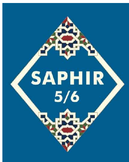
Saphir 5/6 . Religionsbuch für junge Musliminnen und Muslime

Für Behr war dies allerdings durchaus eine bewusste Entscheidung. Für ihn sind es schließlich zunächst einmal die Moschee und das Elternhaus, die muslimischen Kindern zum Beispiel den Gebetsritus zu vermitteln hätten. „In der Schule hat dies keinen Platz“, betont er.